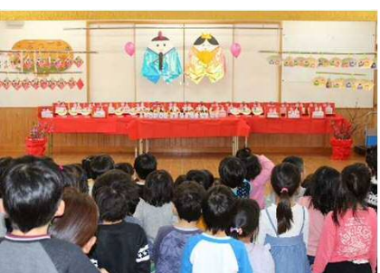
和光園慰問 ひな祭り会

※4月28日(日)から5月6日(月)は保育園はお休みとなります。連休中、特に事故等には十分注意されてお過ごし下さい。